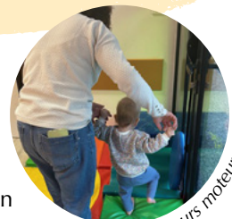
Atelier parcours moteur

Pour les enfants : il propose des activités d'éveil et de socialisation.