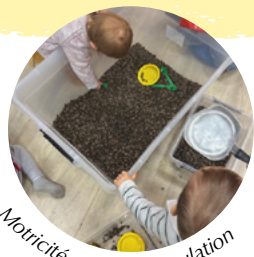
Motoricité par la manipulation

C'est un service destiné aux assistants maternels , aux familles et aux professionnels de la petite enfance . Il propose un accompagnement et des informations sur l'accueil du jeune enfant, les droits et obligations des employeurs et salariés. Le relais propose également, trois matinées par semaine, des ateliers d'éveil à destination des assistants maternels et des MAM accompagnés des enfants qu'ils gardent.