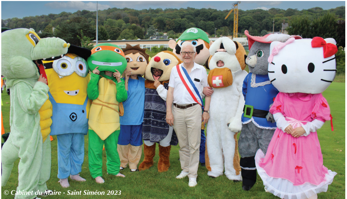
© Cabinet du Maire - Saint Siméon 2023