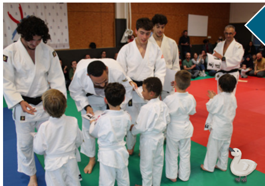
CÉRÉMONIE DES GRADES DU JUDO CLUB