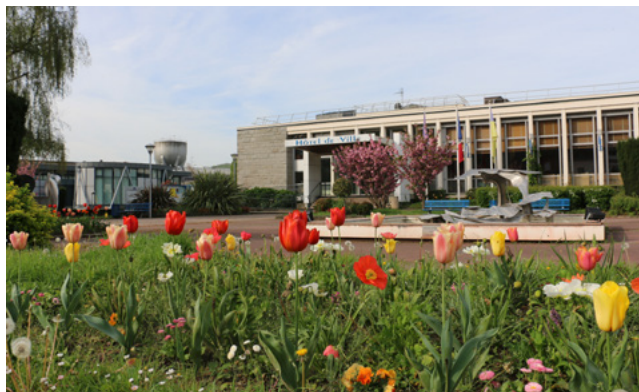
Dominique Gambier Maire de Déville lès Rouen