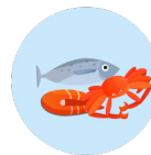
Produits de la mer