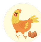
Poules et œufs