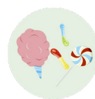
Barbe à papa, bonbons et jouets