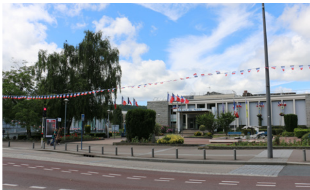
Dominique Gambier Maire de Déville lès Rouen