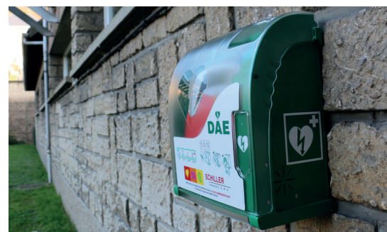
Installation de nouveaux défibrillateurs