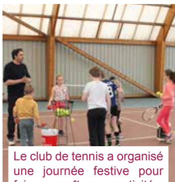
Le club de tennis a organisé une journée festive pour faire connaître ses activités.