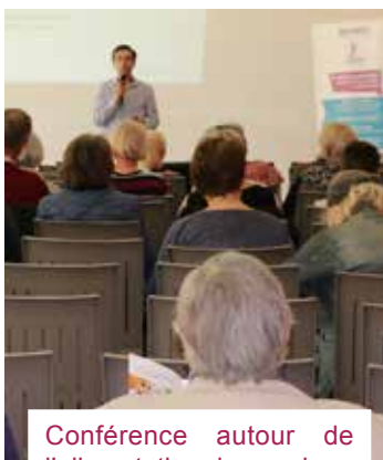
Conférence autour de l'alimentation des seniors.