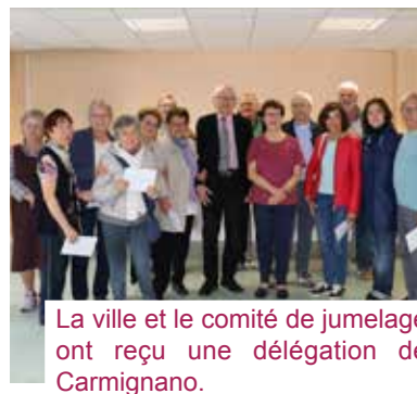
La ville et le comité de jumelage ont reçu une délégation de Carmignano.