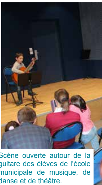
Scène ouverte autour de la guitare des élèves de l'école municipale de musique, de danse et de théâtre.