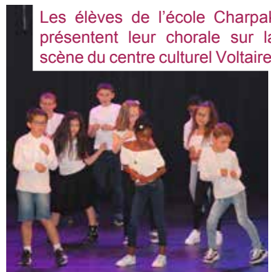
Les élèves de l'école Charpak présentent leur chorale sur la scène du centre culturel Voltaire.