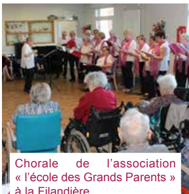
Chorale de l'association « l'école des Grands Parents » à la Filandière.