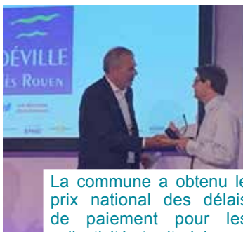
La commune a obtenu le prix national des délais de paiement pour les collectivités territoriales.