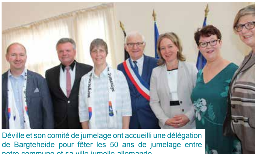
Dèville et son comité de jumelage ont accueilli une délégation de Bargteheide pour fêter les 50 ans de jumelage entre notre commune et sa ville jumelle allemande.