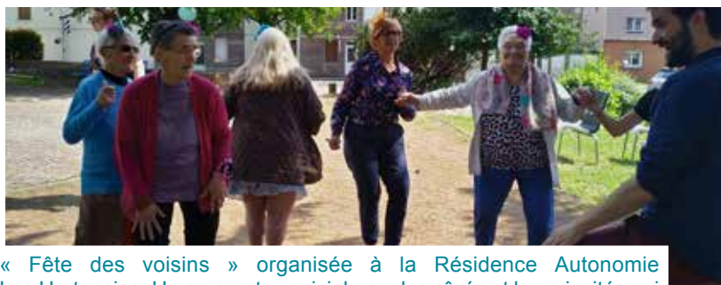
« Fête des voisins » organisée à la Résidence Autonomie Les Hortensias. Un moment convivial pour les aînés et leurs invités qui ont partagé un goûter préparé par la cuisine centrale de la commune.

Retrouvez plus de photos sur le site Internet de la Ville deville-les-rouen.fr