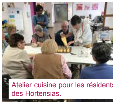
Atelier cuisine pour les résidents des Hortensias.