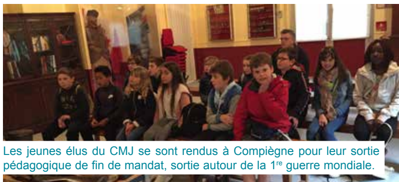
Les jeunes élus du CMJ se sont rendus à Compiègne pour leur sortie pédagogique de fin de mandat, sortie autour de la 1 re guerre mondiale.