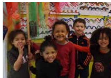
Encore de belles activités proposées aux enfants pendant les vacances de printemps !