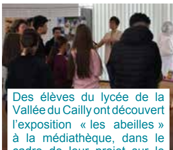
Des élèves du lycée de la Vallée du Cailly ont découvert l'exposition « les abeilles » à la médiathèque, dans le cadre de leur projet sur le changement climatique.