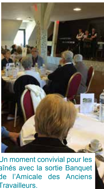
Un moment convivial pour les aînés avec la sortie Banquet de l'Amicale des Anciens Travailleurs.