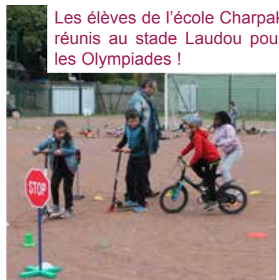
Les élèves de l'école Charpak réunis au stade Laudou pour les Olympiades !