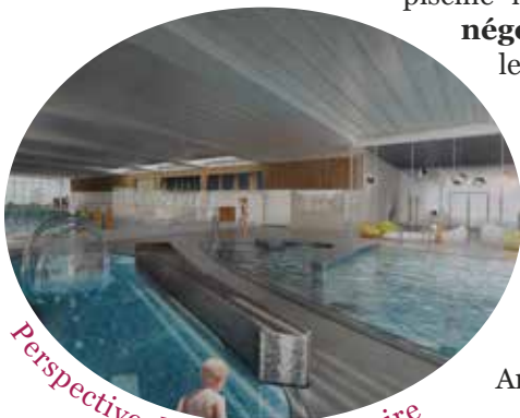
Perspective depuis la patinoire

Après la démolition des bâtiments de l'ancien camping municipal en mars, les premiers coups de pioche lançant le chantier, devraient être donnés entre la fin de l'année 2019 et le début de 2020. A l'heure actuelle, tel que le planning se présente, la nouvelle piscine devrait être achevée avant la fin de l'année 2021 . Ce projet inclut également l'aménagement d'un grand parking rue Jules Ferry et avenue Fauquet, ce dernier sera commun avec l'école maternelle Andersen.