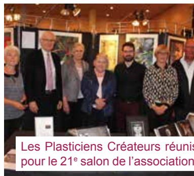
Les Plasticiens Créateurs réunis pour le 21 e salon de l'association.