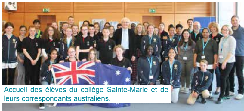
Accueil des élèves du collège Sainte-Marie et de leurs correspondants australiens.