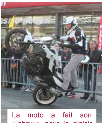
La moto a fait son « show » pour le plaisir des spectateurs !