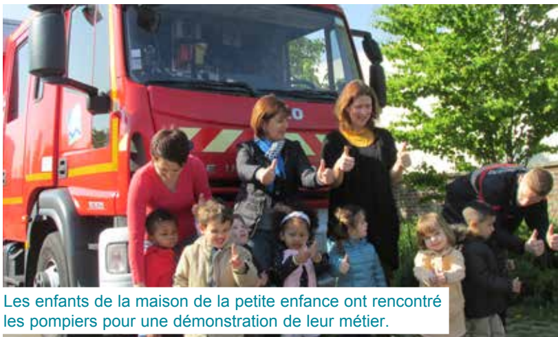
Les enfants de la maison de la petite enfance ont rencontré les pompiers pour une démonstration de leur métier.