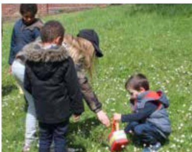
Traditionnelle chasse aux œufs de Pâques proposée par le comité des fêtes dans le parc du Logis.