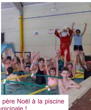
Le père Noël à la piscine municipale !