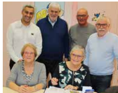
Assemblée générale et galette des rois pour l'ALD randodéville.