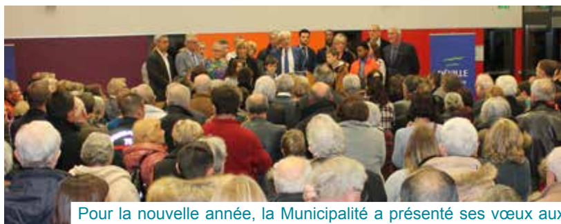
Pour la nouvelle année, la Municipalité a présenté ses vœux aux corps constitués, aux associations et aux habitants.