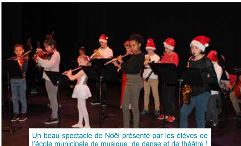
Un beau spectacle de Noël présenté par les élèves de l'école municipale de musique, de danse et de théâtre !