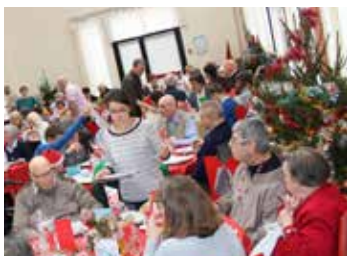
Moment de grande convivialité pour le réveillon des petits frères des pauvres.