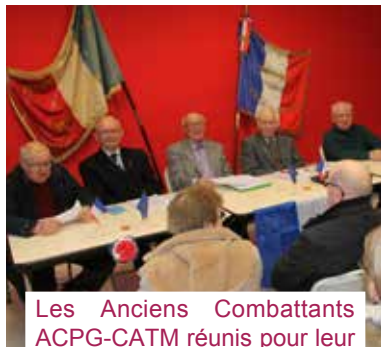
Les Anciens Combattants ACPG-CATM réunis pour leur assemblée générale.