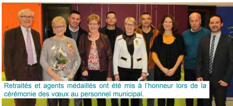
Retraités et agents médaillés ont été mis à l'honneur lors de la cérémonie des vœux au personnel municipal.