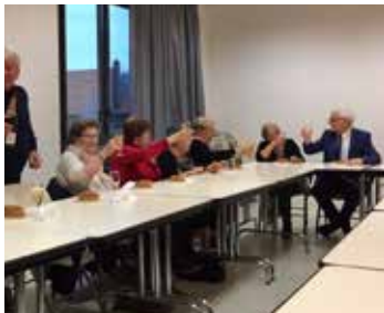
Après son assemblée générale, l'Amicale des Anciens Travailleurs a fêté les rois !