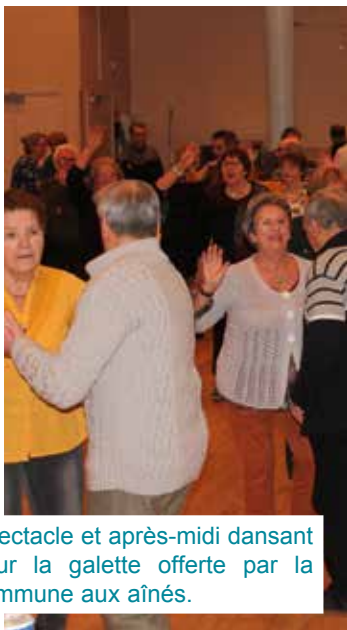
Spectacle et après-midi dansant pour la galette offerte par la commune aux aînés.