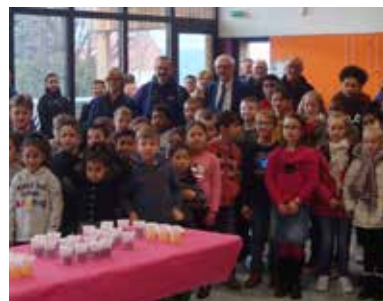
Les enfants de l'USEP se sont également régalés avec la traditionnelle galette !