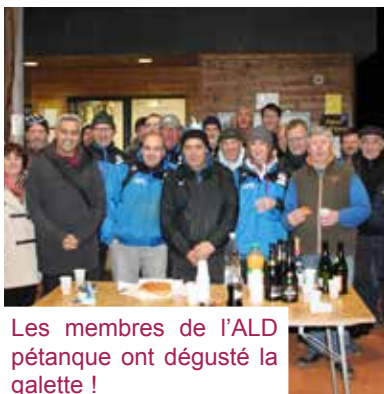
Les membres de l'ALD pétanque ont dégusté la galette !