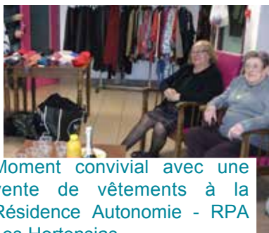
Moment convivial avec une vente de vêtements à la Résidence Autonomie - RPA Les Hortensias.