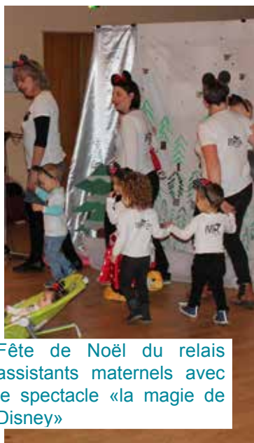
Fête de Noël du relais assistants maternels avec le spectacle «la magie de Disney»