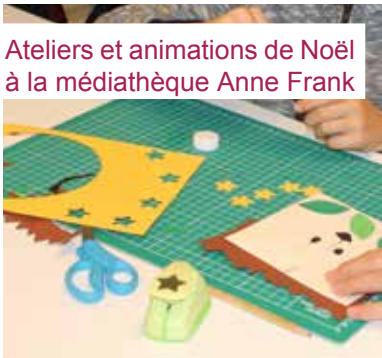
Ateliers et animations de Noël à la médiathèque Anne Frank