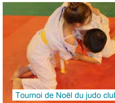
Tournoi de Noël du judo club