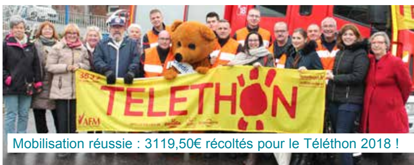
Mobilisation réussie : 3119,50€ récoltés pour le Téléthon 2018 !