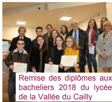
Remise des diplômes aux bacheliers 2018 du lycée de la Vallée du Cailly