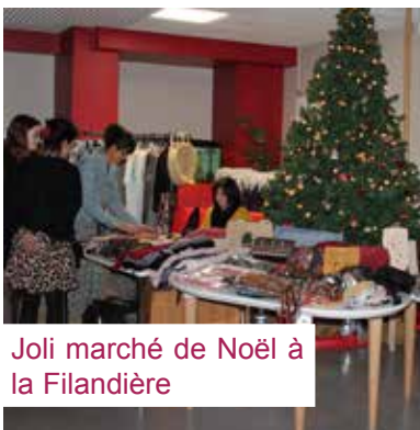
Joli marché de Noël à la Filandière