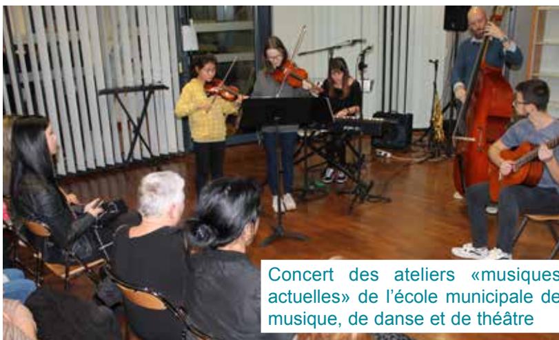
Concert des ateliers «musiques actuelles» de l'école municipale de musique, de danse et de théâtre