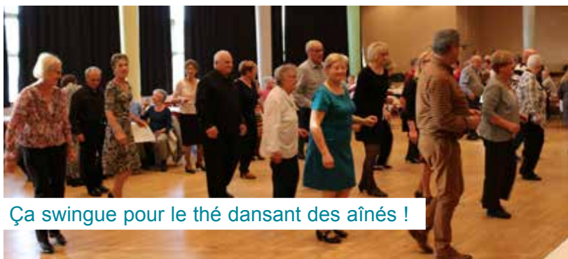
Ça swingue pour le thé dansant des aînés !