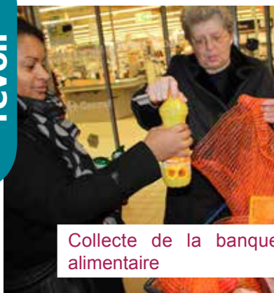
Collecte de la banque alimentaire