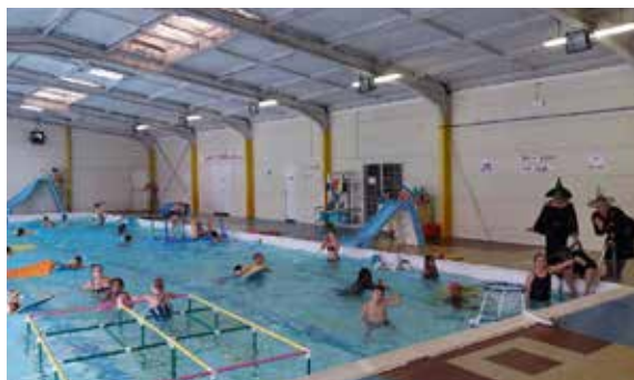
47 enfants, accompagnés de 17 adultes ont participé à l'après-midi Halloween de la piscine municipale, au programme : parcours aquatique et friandises !