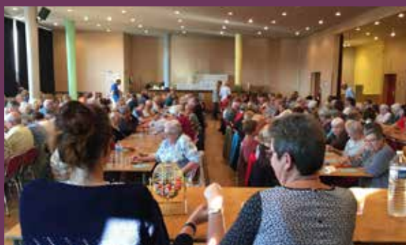
Cette année, les anciens se sont retrouvés pour un après-midi jeux au CHG «la Filandière». Au centre culturel Voltaire, ils ont participé au loto avec les enfants des accueils de loisirs, assisté au spectacle «les joyeux chevaliers du ciel» et dansé au cours du thé dansant. Une semaine qui s'est achevée par le traditionnel Banquet des Anciens où les Doyens ont été mis à l'honneur.

Métropole Rouen Normandie - 0 800 021 021 www.metropole-rouen-normandie.fr