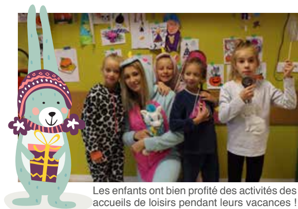
Les enfants ont bien profité des activités des accueils de loisirs pendant leurs vacances !