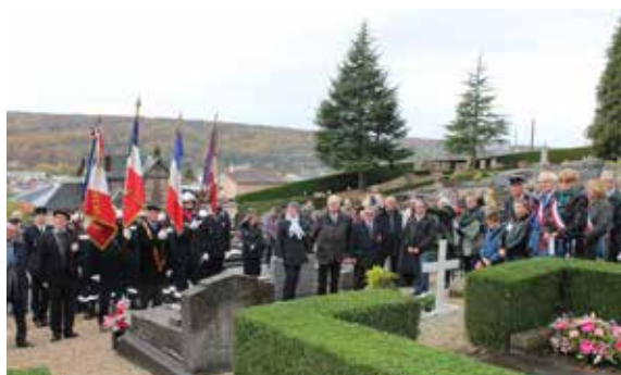
Le 11 novembre, la ville commémorait le centenaire de l'armistice de la première guerre mondiale.