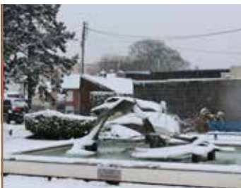
Plan hivernal La commune parée pour la neige !