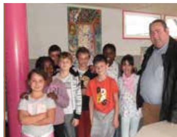
Conseil Municipal des Jeunes Les nouveaux élus !