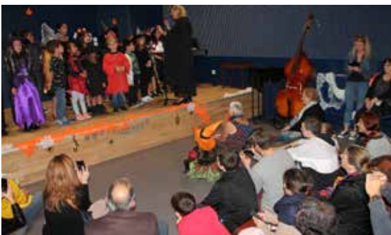
Halloween se fête en danse et en musique, dans la nouvelle maison des arts et de la musique.