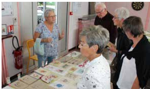
Premières puces des couturières organisées par la section Joseph Delattre de l'Amicale Laïque de Déville.