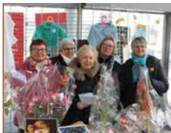
Solidarité Tous mobilisés pour le Téléthon