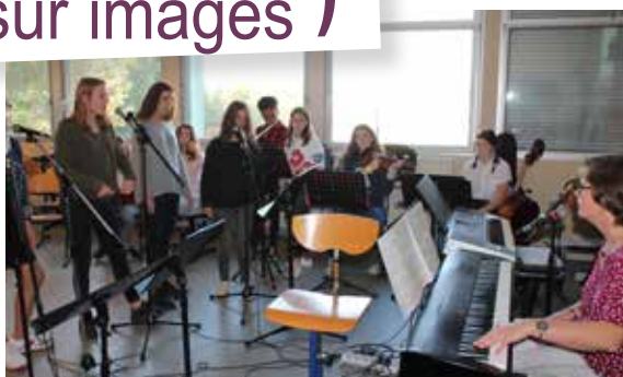
Découverte de l'établissement et échanges avec les équipes pédagogiques au programme des portes ouvertes du collège Jules Verne.