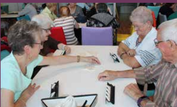
Retour sur la semaine bleue, semaine nationale des retraités et personnes âgées, proposant des animations pour les aînés de la commune.