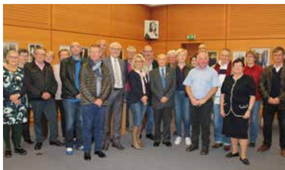
La promotion 2018 des médaillés du travail du secteur privé a été accueillie en Mairie par les élus.