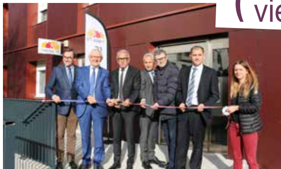
La résidence «La Roseraie» a été inaugurée après 19 mois de travaux menés par le bailleur social Habitat 76 en partenariat avec l'Idefi et la commune.