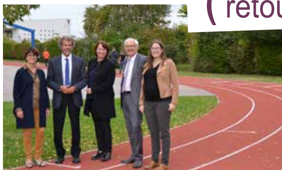
Le lycée de la Vallée du Cailly a inauguré sa nouvelle piste d'athlétisme.