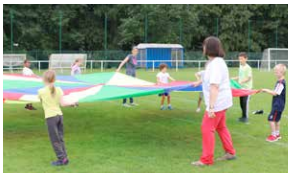
Enseignants et parents d'élèves ont organisé de belles olympiades pour les élèves de l'école Charpak.