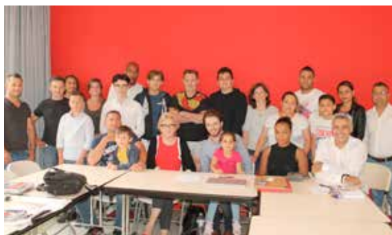
Bilan et projets pour le boxing club à l'occasion de l'assemblée générale de l'association.