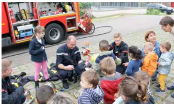
Un moment toujours magique pour les tout-petits de la maison de la petite enfance : la rencontre avec les pompiers !