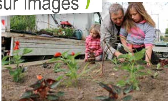
Les participants au dispositif Contrats Partenaires Jeunes ont réalisé les plantations devant l'Hôtel de Ville avec les agents des services techniques.