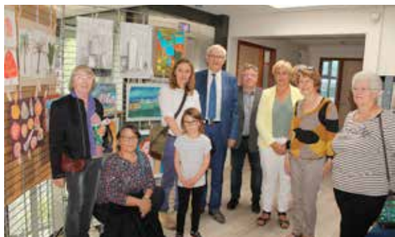
Vernissage de l'exposition des Activités Bien-être Culturelles de Déville (ABCD) !