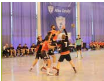
Sport Les sportifs dévillois toujours au top !