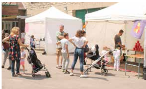
Kermesse également à l'école Crétay avec chamboule-tout, pêche aux canards, maquillage...