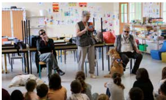
4 classes de l'école Jean-Jacques Rousseau ont fait connaissance avec l'association des chiens-guides d'aveugles de Normandie.