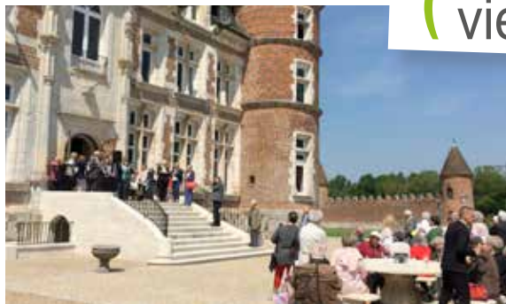
Moment convivial avec la traditionnelle sortie banquet de l'amicale des anciens travailleurs.