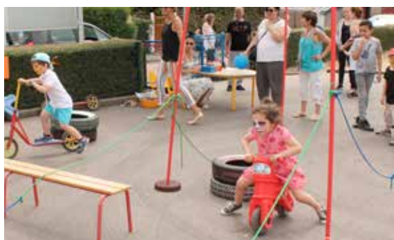
La kermesse à l'école Andersen et les différents stands ont permis aux plus jeunes de bien s'amuser.