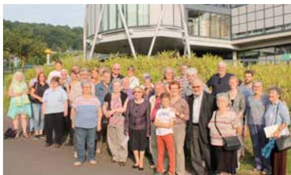
Une délégation de Bargteheide, ville jumelée, a été accueillie par la ville et le comité de jumelage.