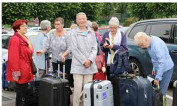
Les seniors ont passé une belle semaine à la découverte de l'Italie.