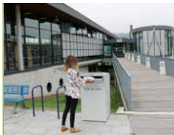
Médiathèque Anne Frank Une boîte pour rendre les documents empruntés