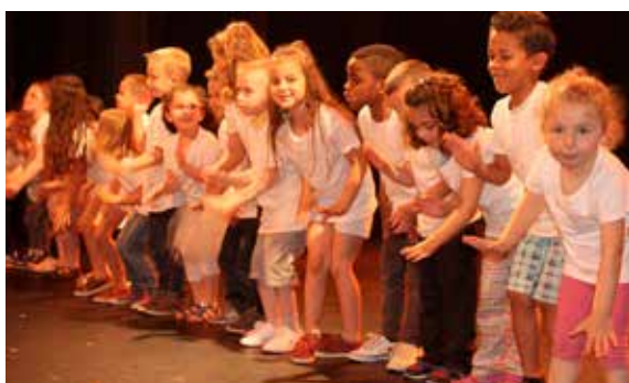
La fin de l'année scolaire se fête en spectacle à l'école Bitschner.