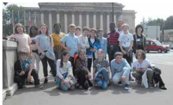
Les jeunes élus du Conseil Municipal des Jeunes ont visité l'Assemblée Nationale.