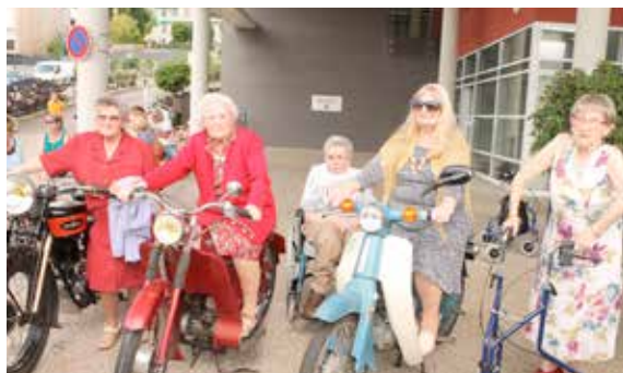
Les aînés de la Filandière profitent des différents animations organisées : ici, une exposition de véhicules anciens !