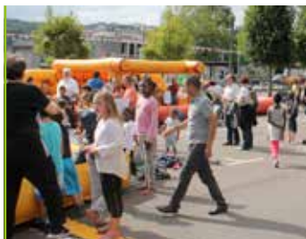
Fête Nationale Le plein d'animations pour le 14 juillet