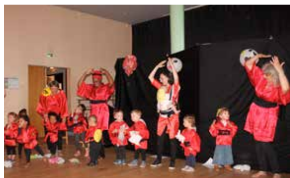
Une fête de l'été placée sous le nouvel an chinois, du côté du relais assistants maternels.