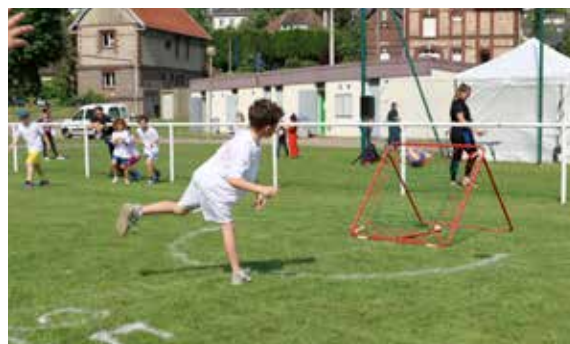
Fête de fin d'année pour l'Usep : les enfants étaient réunis sur le stade Laudou !