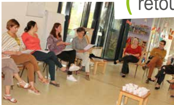
Réunion autour du «langage» avec l'équipe de la maison de la petite enfance, les familles et les assistantes maternelles du relais.