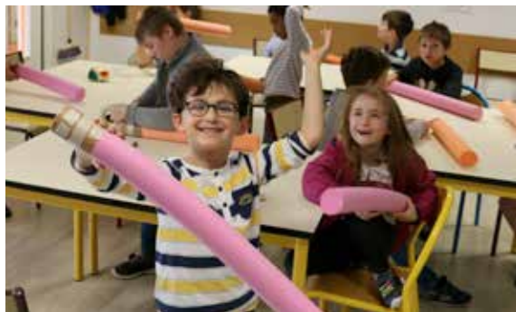
Des activités, des copains et le plein de bonne humeur : les enfants ont bien profité des vacances à l'accueil de loisirs !