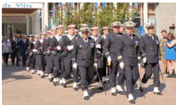
la présence exceptionnelle, de la Préparation Militaire Marine de Rouen (PMM).

Si l'année scolaire n'est pas encore terminée, il est déjà possible de préparer la rentrée 2018.