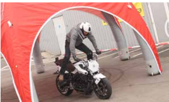
La moto à l'honneur le temps d'un week-end festif organisé par l'association Motardscie !