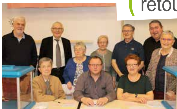
Les membres du comité de jumelage réunis pour l'assemblée générale de l'association