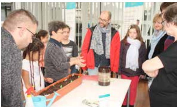
Semis et plantes germées n'ont plus de secret pour les participants à l'atelier proposé à la médiathèque !