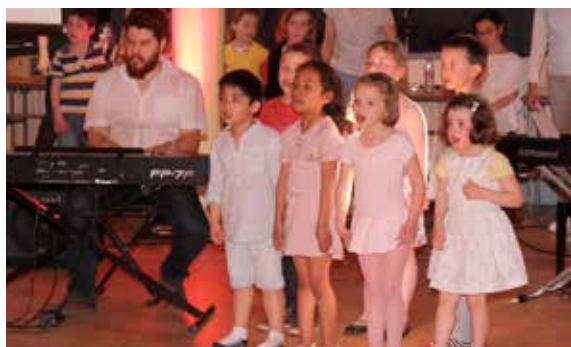
Cabaret des artistes en herbe de l'école municipale de musique, de danse et d'art dramatique : les plus jeunes élèves ont présenté un beau spectacle !