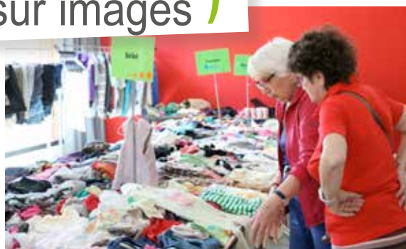
La braderie des Familles de France : l'occasion de faire de belles affaires !