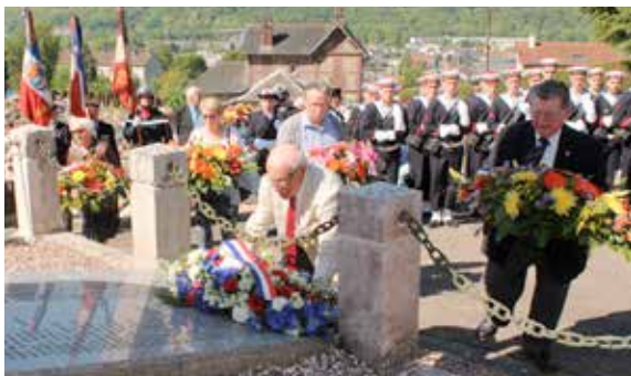
Anciens combattants, élus et habitants réunis pour les cérémonies commémoratives du 8 mai, avec, cette année,