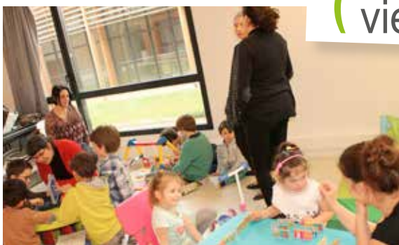
Rencontres, échanges et partages lors de la papothèque.