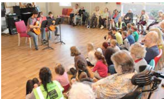
Concert de printemps des élèves de l'école municipale de musique, de danse et d'art dramatique à la Filandière.