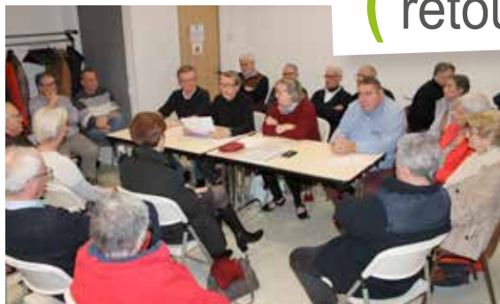
Les membres du comité de fêtes se sont réunis pour leur assemblée générale.