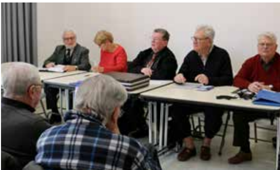
Les anciens combattants de l'UNC également réunis pour l'assemblée générale de l'association.