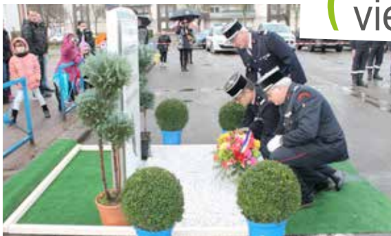
Hommage des sapeurs pompiers de Déville pour la Saint Barbe.