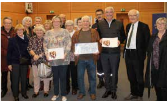
2 654,75€ ont été récoltés pour le Téléthon 2017.