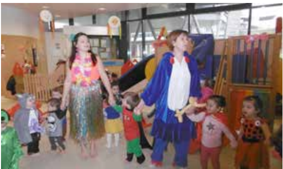
Grande fête à la maison de la petite enfance pour le carnaval !