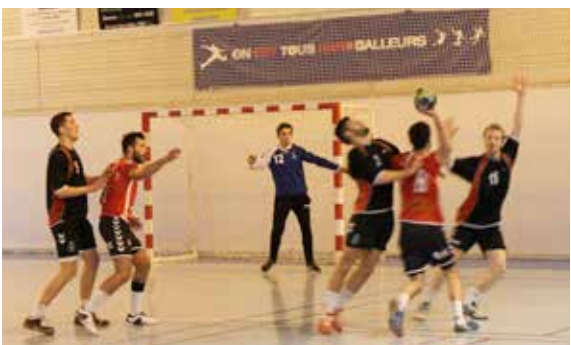
L'ALDÉVILLE Handball a reçu les matchs de 16 e et 8 e de finale coupe de France Régionale et Départementale