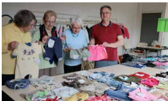
Vous avez manqué la bourse aux vêtements des Familles de France ? L'association organise une braderie le mercredi 18 avril.