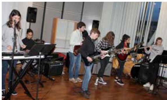
L'école municipale de musique, de danse et d'art dramatique a présenté plusieurs concerts, notamment à la médiathèque.