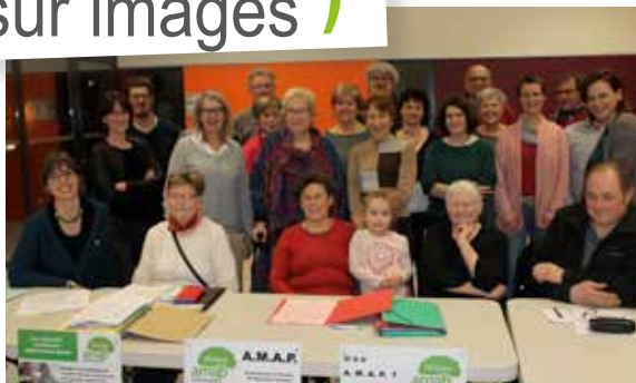
Assemblée générale pour l'AMAP en présence de producteurs locaux.