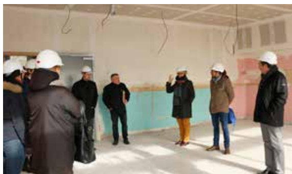
Visite de la maison des arts et de la musique avec les enseignants de l'école Andersen qui occuperont une partie des locaux pendant la rénovation de l'école maternelle.