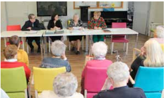
L'association arts et loisirs des cheveux d'argent a présenté le bilan de l'année passée et projets pour l'année à venir.