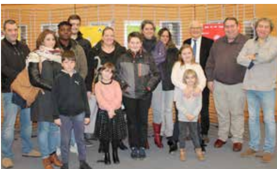
Les contrats partenaires jeunes sont signés !