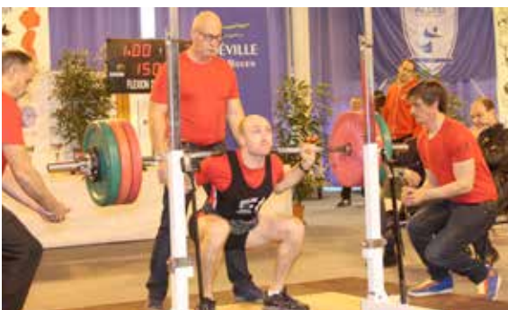
La musculation à l'honneur avec la demi-finale Force athlétique et Challenge Panazio.