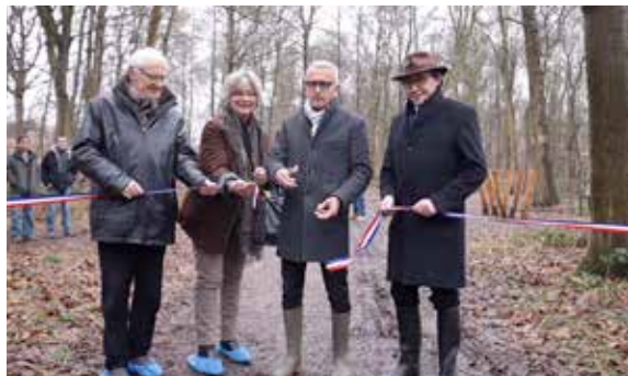
Inauguration du parcours sportif du bois l'Archevêque.