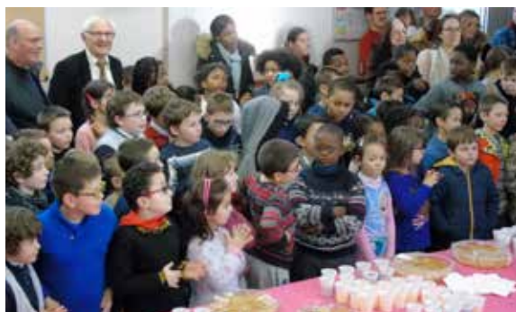
Galette toujours pour les enfants de l'USEP !