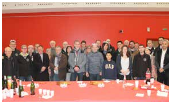
la cible dévilloise