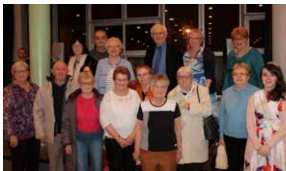
Pour les aînés, les rois se fêtent en spectacle !