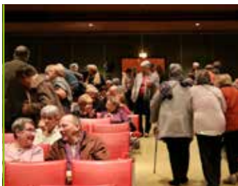
Seniors Un spectacle pour le printemps