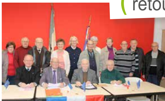
Les anciens combattants se sont retrouvés pour l'assemblée générale des ACPG-CATM.