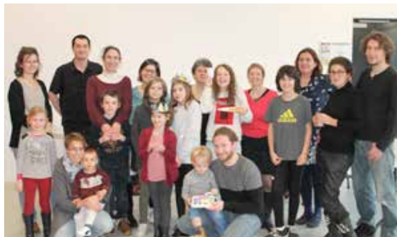
le Démon des jeux