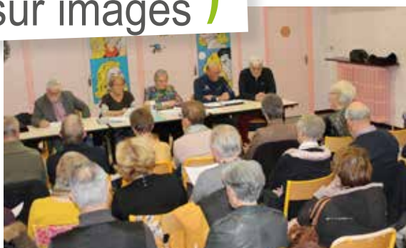
L'heure du bilan également pour l'ALD randodéville...