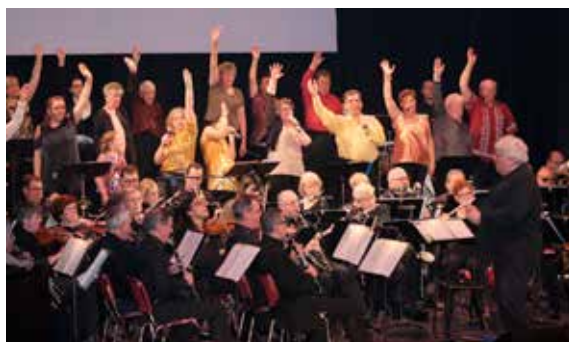
Succès pour le concert autour du cinéma de l'Orchestre Symphonique de Déville.