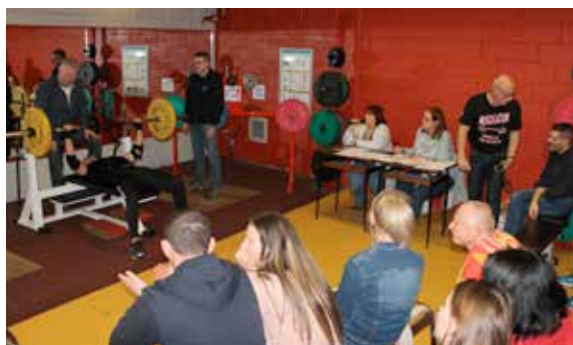
Challenge de musculation avant de partager la galette !