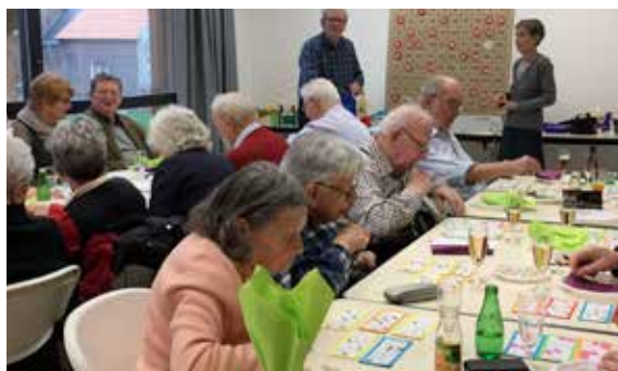
Les anciens combattants de l'UNC ont eux aussi fêté les rois tout en jouant au loto !