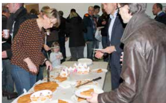
le vélo club