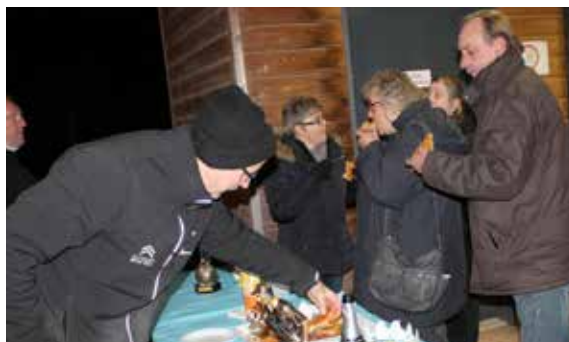
Les associations de la commune ont fêté les rois ! l'ALD Pétanque