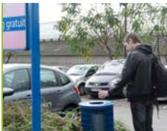
Propreté de la commune Tous concernés !