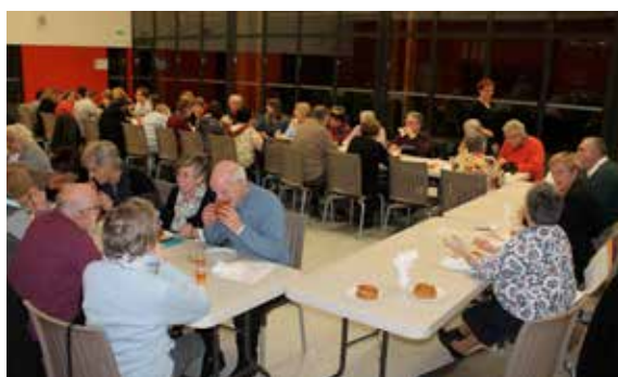
Galette également pour le comité de Jumelage