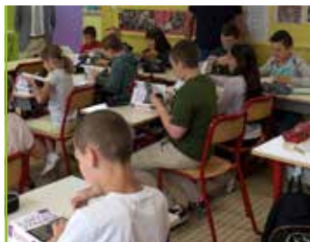
Rythmes scolaires Retour à la semaine de 4 jours