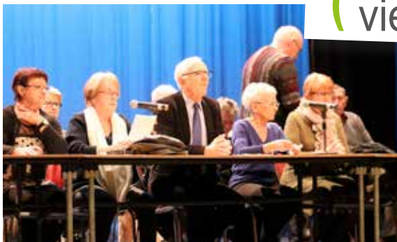
... et les membres de l'Amicale des Anciens Travailleurs