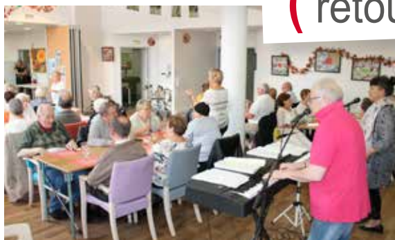
Temps fort de l'année pour les aînés : la semaine bleue ! Cinq jours d'animations concoctées spécialement pour