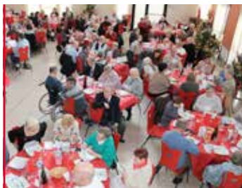
Fêtes de fin d'année Le plein d'animations pour Noël