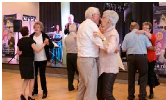
mais aussi après-midi dansant ! Une semaine qui se clôture par le traditionnel Banquet des Anciens, au cours duquel les