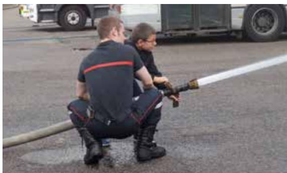
les activités proposées par les accueils de loisirs pendant les vacances !