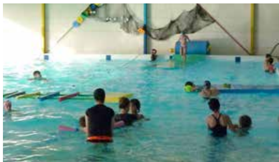
La piscine fête Halloween en proposant un parcours aquatique. Les courageux participants sont repartis avec une gourmandise !