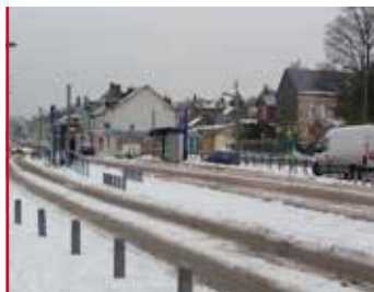
Températures hivernales Que faire en cas de neige ou verglas ?