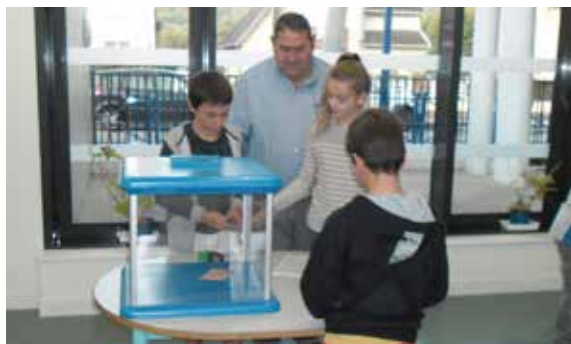
Les élèves de CM1 des trois écoles élémentaires ont élu leurs représentants au Conseil Municipal des Jeunes : les résultats sont à découvrir en page 10 !