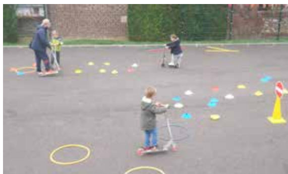
S'amuser, apprendre et devenir un peu plus grand avec