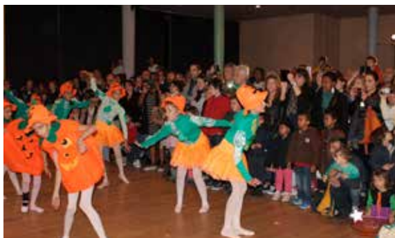
Pas de grosses frayeurs mais un agréable moment avec le spectacle «Les Fantômes de Voltaire» des élèves de l'école municipale de musique, de danse et d'art dramatique.