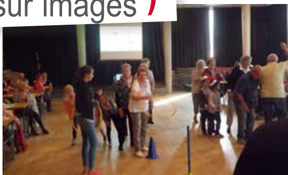
les personnes âgées. Repas festif à la Filandière, jeux et échanges avec les enfants de l'accueil de loisirs,