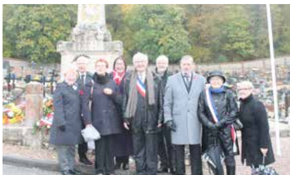
Le comité de jumelage a reçu une délégation de Syston venue assister aux cérémonies commémoratives du 11 novembre.