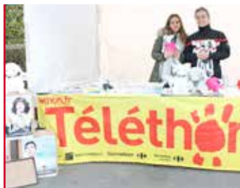
Téléthon Les bénévoles comptent sur vous