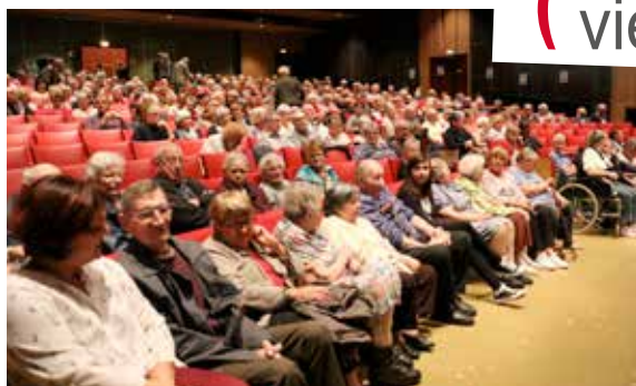
détente avec le spectacle «les jumeaux fantastiques»