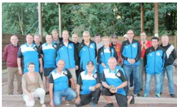
Challenge réussi pour le club de l'ALD Pétanque !