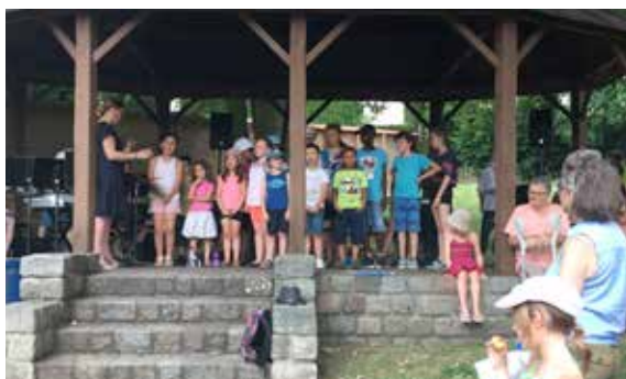
...tout comme les élèves de musique qui ont également proposé plusieurs prestations à l'occasion de la fête de la musique !