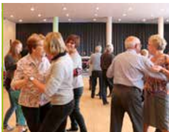
Semaine bleue Les aînés à l'honneur !