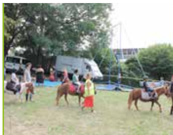
Saint Siméon Une fête aux couleurs de l'Amérique