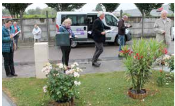
Le jury a fait son choix et les participants au concours des maisons, jardins et balcons fleuris sont récompensés le samedi 16 septembre en Mairie !

Syndicat des Biens Communaux de la Muette