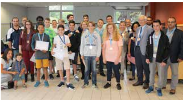
Remise des diplômes et médailles aux équipes de handball «minime garçon» et basketball «benjamin garçon» de l'UNSS du collège Jules Verne.