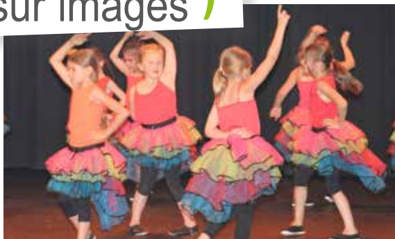
également présenté un très joli spectacle de danse au centre culturel Voltaire