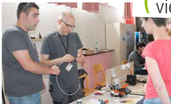
Informations techniques et pratiques : Orange a répondu aux questions des habitants sur l'arrivée de la fibre optique.