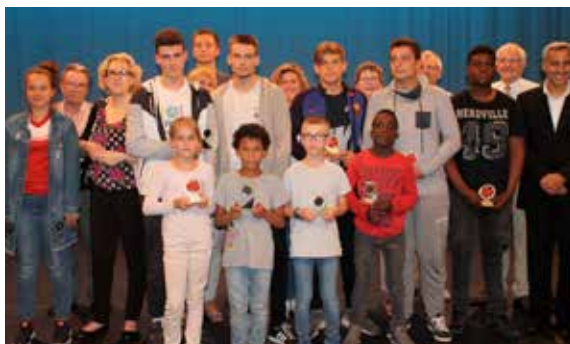
Une belle saison sportive (évoquée dans le déville infos de juillet-août) et mise à l'honneur au centre culturel Voltaire.