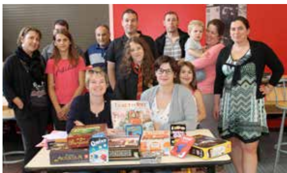
L'association «le Dévil(le) des Jeux» a clôturé sa première année de vie à l'occasion de son assemblée générale et ne manque pas de projets pour l'année à venir !