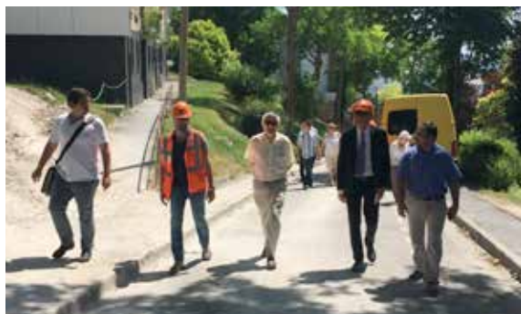
Les élus ont visité et ainsi fait le point sur l'avancée du chantier de rénovation des immeubles du Tronquet.