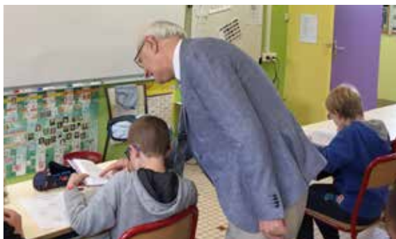
Fin d'année scolaire mais surtout fin de l'école primaire pour les élèves de CM2 à qui la Municipalité a offert un dictionnaire pour leur entrée au collège.