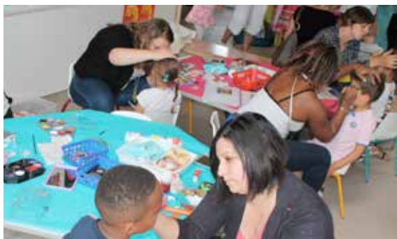
l'école Perrault ! Un moment de fête pour tous !