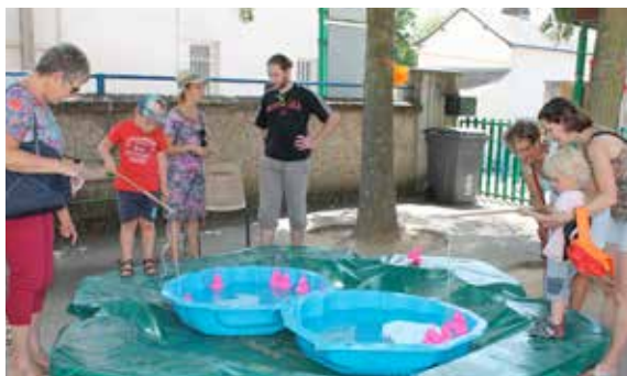
Kermesse de fin d'année pour l'école Crétau mais aussi