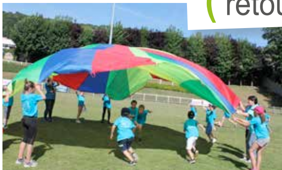
Fête du sport et fête de fin d'année pour l'Usep qui a