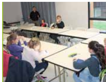
Conseil Municipal des Jeunes 1 an déjà !