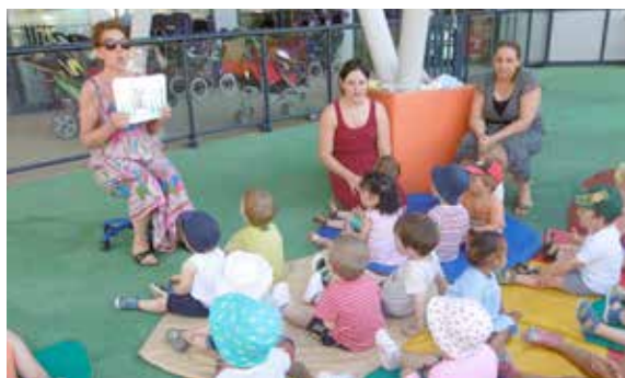
Fête de la musique et de l'été, la maison de la petite enfance a elle aussi marquée la fin de l'année avant les vacances des enfants !