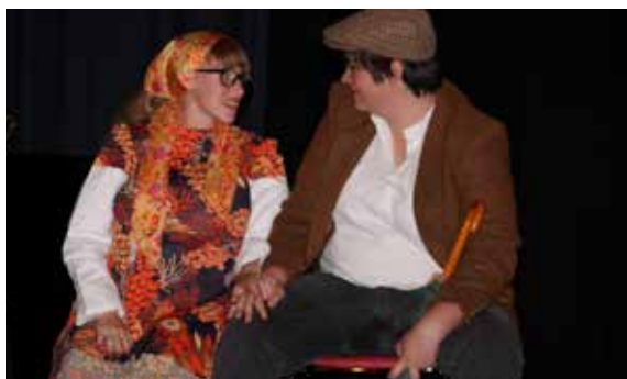
Les élèves des cours d'art dramatique de l'école municipale ont présenté leur spectacle de fin d'année...