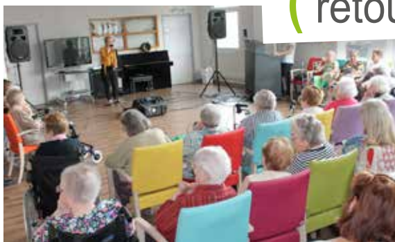
Représentation de l'association « Artistes en Seine » pour les résidents de la Filandière.