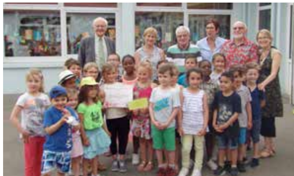
Les petits jardiniers de l'école Perrault récompensés pour leur travail !