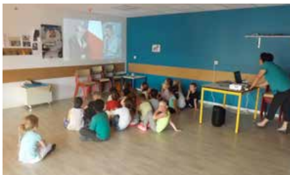
Les élèves de la grande section de l'école Crétay ont assisté au retour de Thomas Pesquet dans le cadre de leur projet de classe.