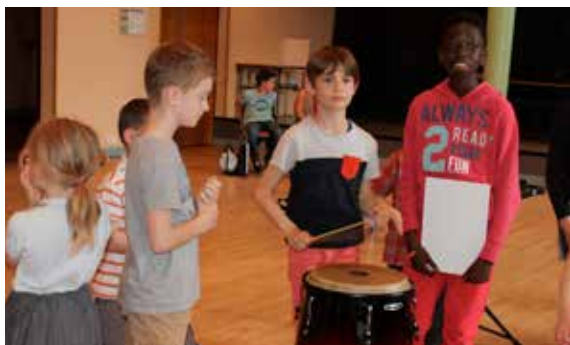
Journées portes ouvertes de l'école municipale de musique, de danse et d'art dramatique : l'occasion de découvrir les cours et pourquoi pas, susciter des vocations !