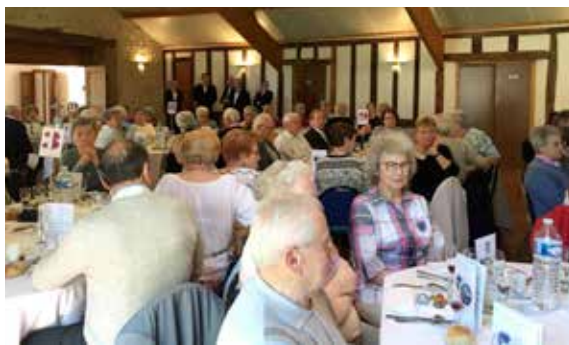
La sortie banquet de l'amicale des anciens travailleurs reste un moment d'une grande convivialité pour les aînés.