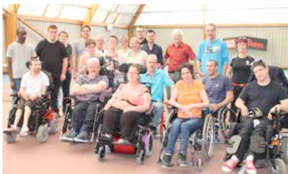
Journée tennis pour tous avec découverte du tennis en fauteuil, du tennis en roller et du tennis pour déficients visuels.

Retrouvez plus d'images sur le site Internet de la Ville