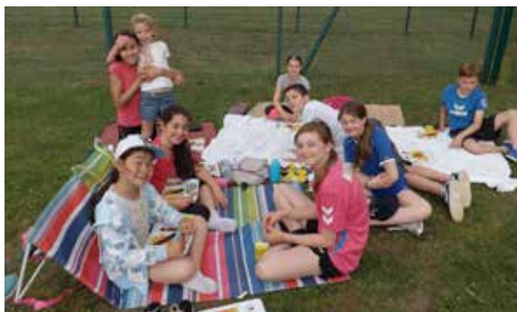
Moment de détente pour les élèves de l'école Charpak qui reprennent des forces avec le repas préparé par la restauration collective pour les olympiades !