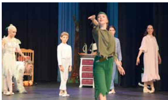
Les élèves des classes de danse de l'école municipale ont présenté « La fabuleuse histoire de Peter Pan » pour leur spectacle de fin d'année.

Le Conseil de juin est toujours l'occasion de solder les comptes de l'année 2016. Les dépenses ont été bien tenues, les subventions attendues sont arrivées, ce qui nous permet de constater en fin d'année un excédent d'un peu plus de deux millions d'euros. Ceci nous permet de continuer à financer nos projets futurs : ZAC des Rives de la Clairette, école Andersen, Maison des arts... tout en assurant l'entretien de notre patrimoine.