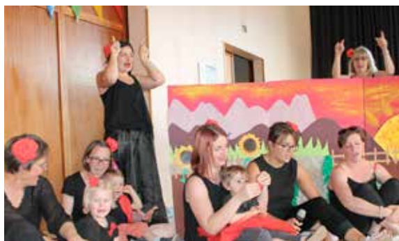
... le ram qui a aussi fêté l'été avec un spectacle aux couleurs de l'été !