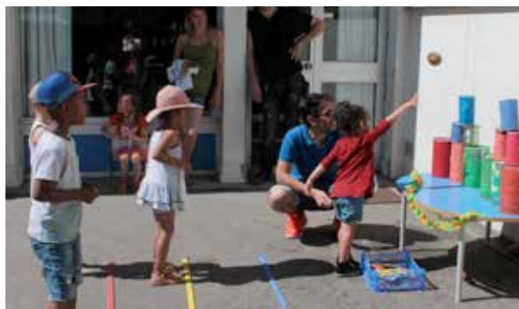
Chamboule-tout, pêche aux canards, maquillage et autres stands ont ravi les enfants de l'école Andersen à l'occasion de la kermesse !