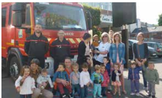
Les enfants et leurs assistantes maternelles du relais (ram) ont visité la caserne des pompiers...