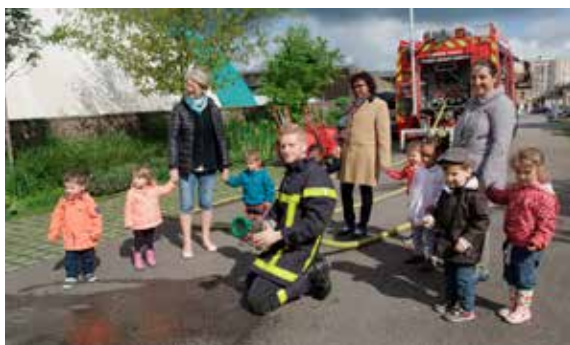
Moment fort de l'année pour les enfants les plus grands de la crèche : la rencontre avec les pompiers !