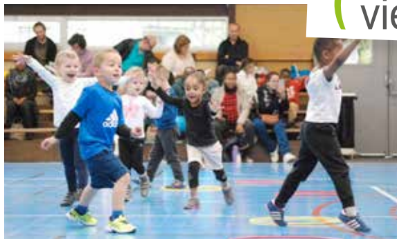
Un beau succès pour le «babyhand» proposé par l'ALDHandball à l'attention des tout-petits et leurs parents.