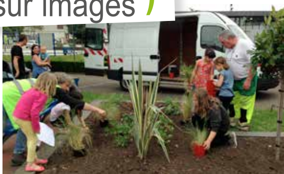
Les jeunes participants au dispositif Contrats Partenaires Jeunes ont effectué leur dernière contrepartie avec la plantation des massifs devant l'Hôtel de Ville.