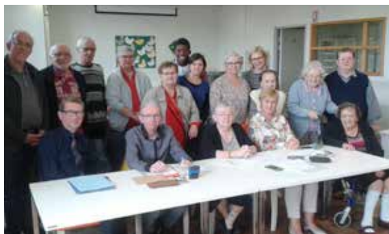
L'association «arts et loisirs des cheveux d'argent» qui accompagne les résidents de la Filandière, s'est réunie pour son assemblée générale !