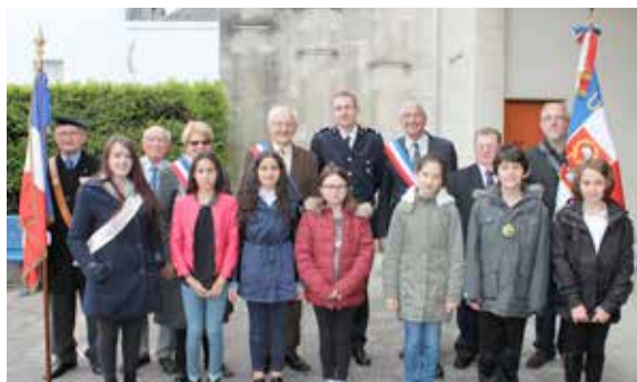
de l'école Bitschner le 15 mai 1945, une lecture faite par des élus du Conseil Municipal des Jeunes.