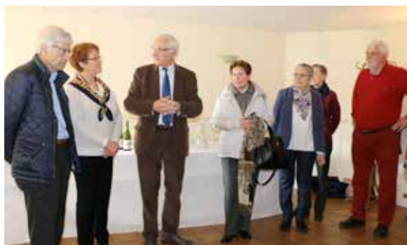
Dans le cadre du comité de jumelage, une délégation de Carmignano a été reçue !