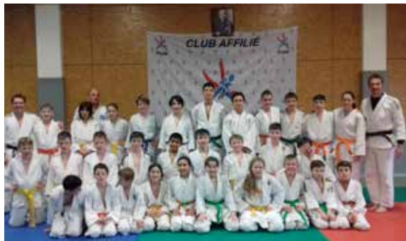
Le judo club a accueilli des judokas d'Ostrava (République Tchèque).