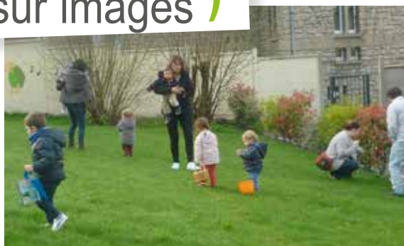
du relais assistants maternels et de la structure collective