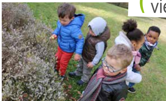
de la maison de la petite enfance, ont enchanté les enfants !