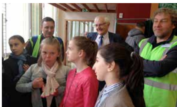
Apprentissage de la citoyenneté pour les élus du Conseil Municipal des Jeunes qui ont découvert l'organisation d'un bureau de vote au cours de l'élection présidentielle.