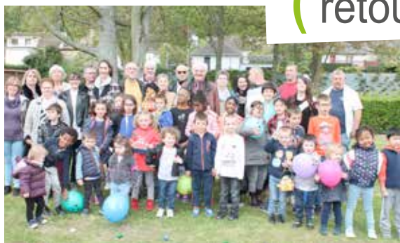
Les chasses aux oeufs de Pâques du comité des fêtes,