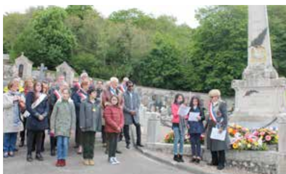
Les cérémonies commémoratives du 8 mai ont été marquées par la lecture d'une lettre écrite par la directrice