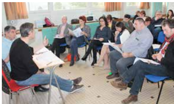
Assemblée générale de l'aroeven, association partenaire de la commune pour les séjours de l'été des jeunes !