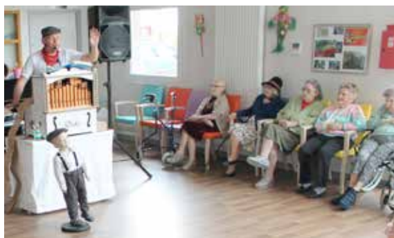
Un orgue de barbarie et voilà un bel après-midi musical pour les résidents de la Filandière !