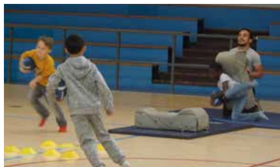
Petits et grands enfants se sont bien dépensés lors de la séance de football américain organisé pendant les vacances à l'accueil de loisirs.