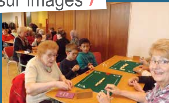
Moments de rencontres et de partages autour des jeux pour les seniors et les enfants de l'accueil de loisirs.