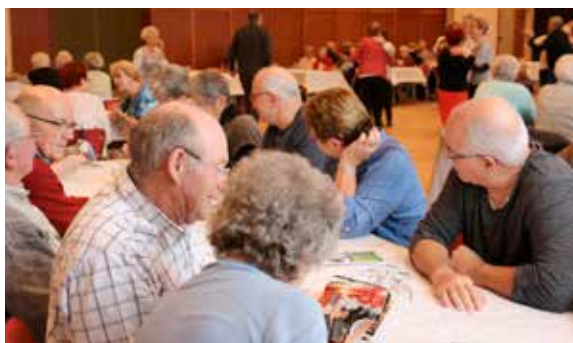
Après-midi convivial pour la rétrospective des voyages des aînés !