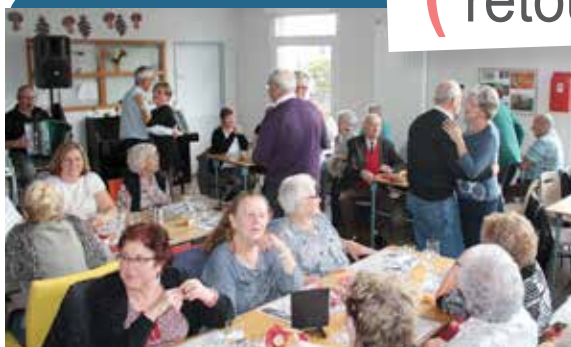
La semaine dédiée aux aînés de la Ville s'est ouverte par le repas aux couleurs des « quatre saisons » organisé à la Filandière.