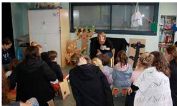
Le succès était au rendez-vous de la première séance des «contes de la petite souris» ! Prochain rendez-vous le samedi 10 décembre !