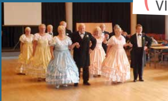
...un après-midi placé également sous le signe de la danse avec la belle prestation du groupe de danses anciennes