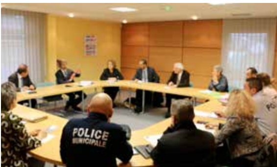
Réunion annuelle avec les acteurs locaux : établissements scolaires du secondaire, police municipale et services municipaux