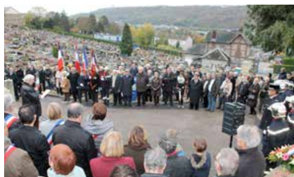
Traditionnelles cérémonies commémoratives du 11 novembre devant le monument aux morts...