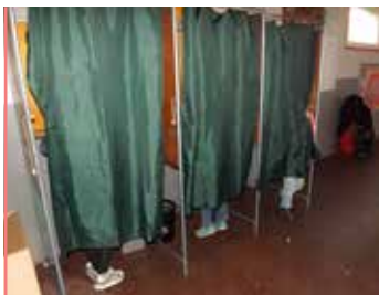
Conseil Municipal des Jeunes les jeunes ont voté