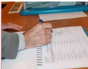
élections 2017 êtes-vous bien inscrit sur les listes électorales ?