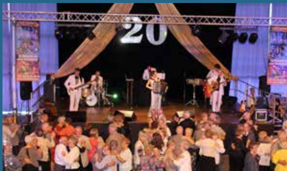
La semaine bleue s'est terminée en beauté avec le traditionnel Banquet des Anciens, placé, pour cette 20 ème édition, sous le signe de la Lumière !