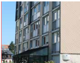
la Roseraie Une résidence en devenir