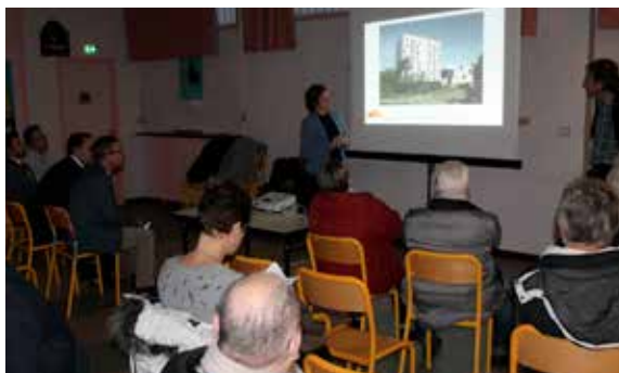
Le projet de réhabilitation de l'ancien bâtiment «la Roseraie» présenté aux riverains par Habitat 76.