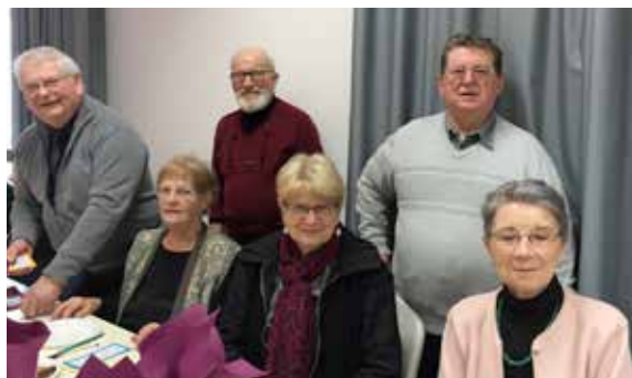
Les Anciens Combattants de l'UNC se sont retrouvés pour partager la galette des rois.