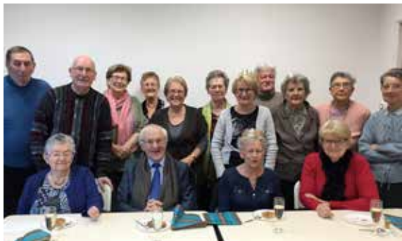
L'Amicale des Anciens Travailleurs a aussi organisé sa galette des rois.