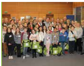
Conseil Municipal des Jeunes Un logo à créer !