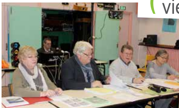
Assemblée générale également pour les membres de l'Orchestre Symphonique de Déville.