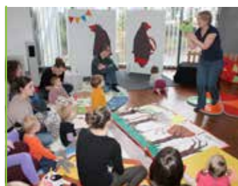
Petite enfance Un mois d'animation pour les plus petits !