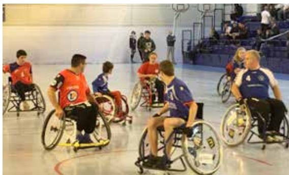
Démonstration de handfauteuil au cours du weekend organisé par l'ALD hanball.