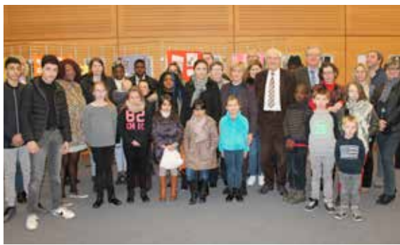
12 Contrats Partenaires Jeunes ont été signés cette année !