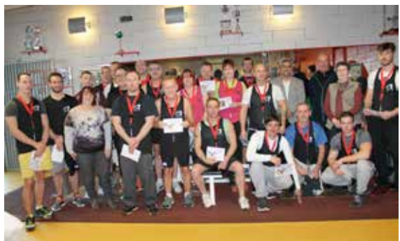
Après l'effort, le réconfort ! L'ALD musculation n'a pas oublié de partager la traditionnelle galette des rois !