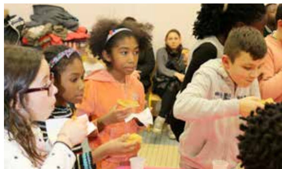
Les enfants se sont bien régalez avec la galette de l'USEP.