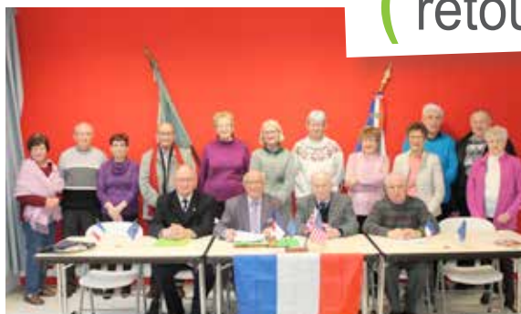
Les Anciens Combattants réunis pour l'assemblée générale de l'ACPG-CATM.