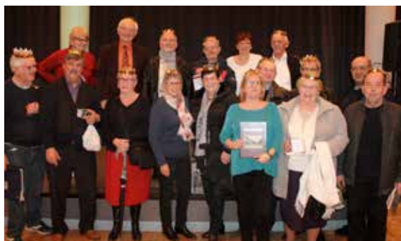
Spectacle et après-midi dansant pour la galette offerte par la Commune aux Aînés.