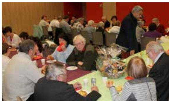
Tradition oblige, le Comité de Jumelage a également fêté les rois !