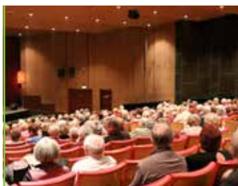
Seniors Un spectacle pour le Printemps