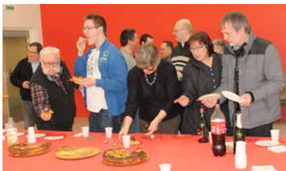
Du côté de la Cible Dévilloise, on se régale aussi !