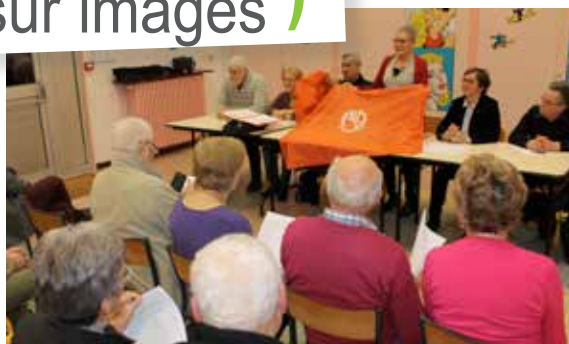
Les Randonneurs se sont également retrouvés pour évoquer l'année écoulée et les projets à venir.