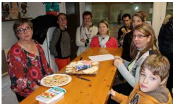
Moment convivial à l'occasion de l'assemblée générale du Tennis Club.