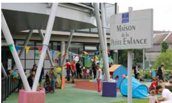
La fête de l'été de la Maison de la Petite Enfance a été un succès auprès des parents et des enfants qui ont passé ensemble un vrai moment de bonheur.