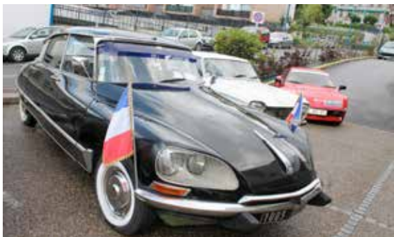
Il y avait de quoi en prendre plein les yeux avec l'exposition de voitures anciennes à La Filandière.