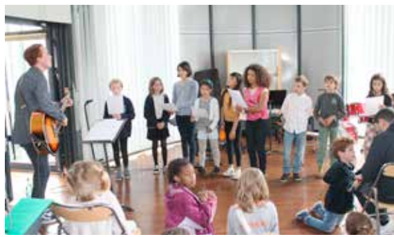
Les élèves de l'école municipale de musique, de danse et d'art dramatique se sont produits à la médiathèque pour la fête de la musique, avant de se rendre au centre culturel Voltaire.