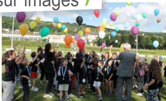
Encore une belle journée placée sous le signe de la convivialité et de l'amusement pour la fête de l'Usep !