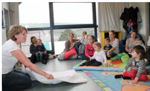
Parents et enfants se sont réunis pour un moment de détente avec les histoires de la marmothèque.