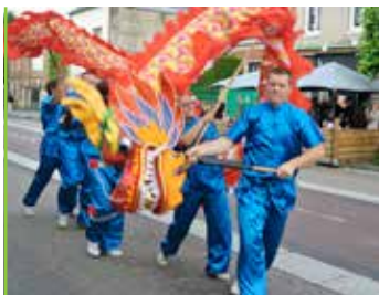
Saint Siméon le rendez-vous à ne pas manquer