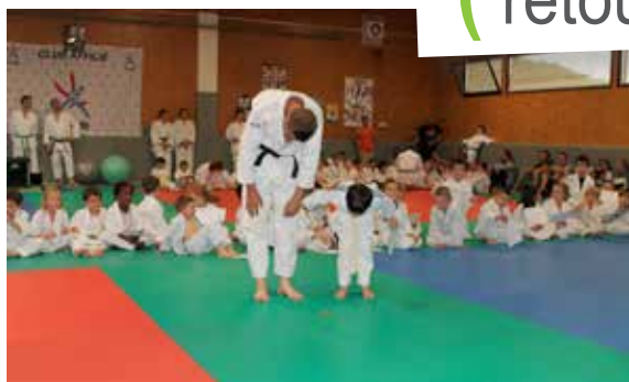
Les judokas ont pris du galon, ils se sont retrouvés pour la cérémonie de remise des grades.