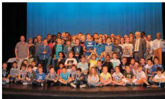
Un grand bravo à tous les sportifs qui ont été récompensés à l'occasion de la réception des sportifs associatifs !