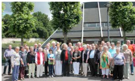
Encore une belle rencontre et beaucoup d'échanges avec cette délégation de Bargteheide qui est venue passer quelques jours dans la commune.