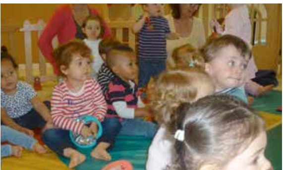
Les tout-petits de la Maison de la Petite Enfance ont aussi eu le droit de faire leur fête de la musique et de jouer un morceau !