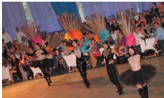
Les spectateurs se sont régalés au spectacle de l'école de danse Savoye.