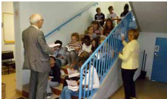
Les élèves de CM2 des écoles élémentaires de la commune ont reçu un dictionnaire de la part de la Municipalité qui souhaite les accompagner pour leur entrée en 6 ème .