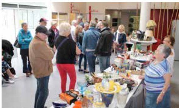
Nombreux étaient les visiteurs à faire des affaires au vide-grenier de La Filandière.