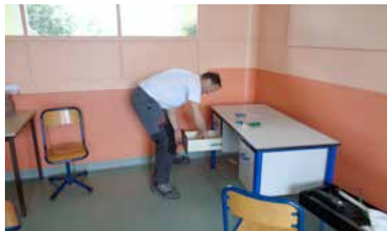
Aménagement d'une nouvelle classe à l'école élémentaire Jean-Jacques Rousseau

Malgré l'ouverture de ces 4 classes, la DSDEN (Direction des Services Départementaux de l'Education Nationale) a décidé la fermeture d'une classe préélémentaire à l'école Andersen. Cette décision se prend en fonction de la « carte scolaire » qui repose sur l'analyse des effectifs des élèves.