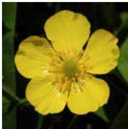
Renoncule âcre ou Bouton d'or