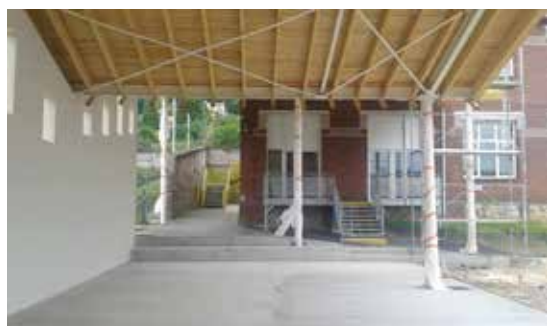
Construction du nouveau préau de l'école Jean-Jacques Rousseau