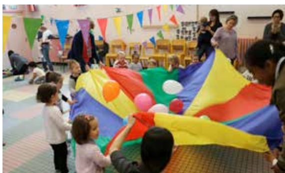
Les assistantes maternelles du ram se sont retrouvées, avec les enfants, pour faire la fête tous ensemble et partager des jeux, des danses et des rires.