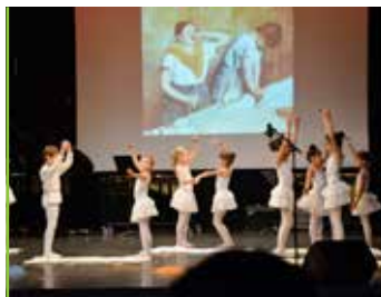
Culture en avant pour une nouvelle et riche saison