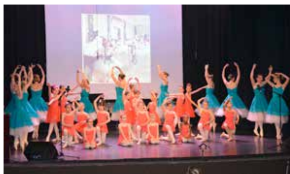
La saison s'est terminée en beauté par le spectacle de fin d'année pour l'école municipale de musique, de danse et d'art dramatique.