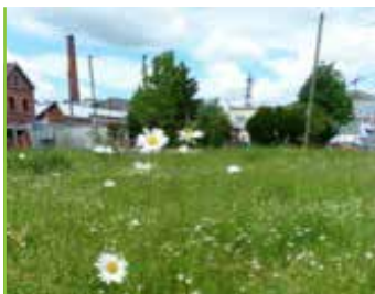
Environnement prendre soin de la nature c'est important