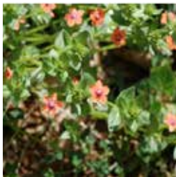
Mouron des champs ou Mouron rouge