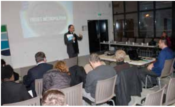
Les habitants de Déville ont pu échanger sur « la Métropole dans 10 ans » lors d'une réunion publique.