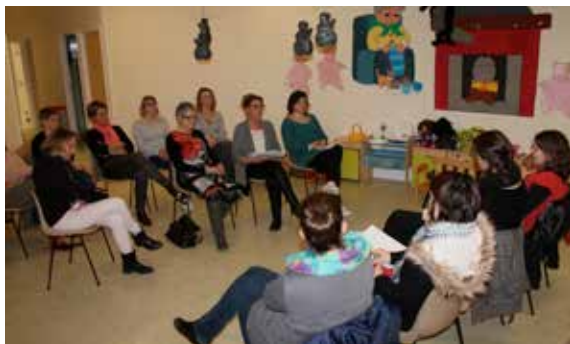
Les parents avaient rendez-vous avec les professionnelles de la Maison de la Petite Enfance pour le conseil de crèche.