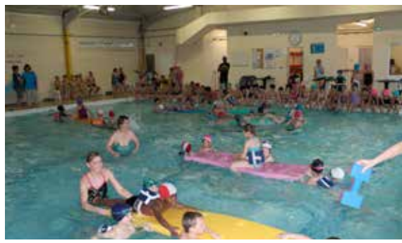
Les enfants se sont bien dépensés lors des jeux nautiques de l'Usep, chasse aux trésors et autres jeux au programme !