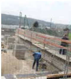
Construction du mur mars 2016

Le chantier devrait se terminer en juillet/août 2016, par la création d'un bassin de rétention d'eaux pluviales.