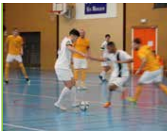
sport le Futsal a de l'avenir à Déville