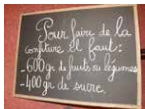
Atelier confection de confiture avant de passer à la dégustation

Pour célébrer les fêtes, marquer les saisons ou encore saluer les régions, des repas spéciaux sont proposés. A cette occasion, les enfants qui participent aux ateliers du temps du midi peuvent réaliser des décorations en lien avec le thème pour les salles de restauration scolaire.