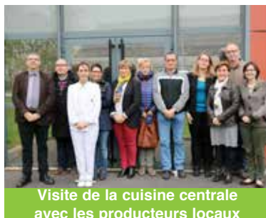
Visite de la cuisine centrale avec les producteurs locaux

Pour les légumes, fruits ou encore produits laitiers, la commune fait appel aux producteurs de la région, ou à l'association Local et Facile. Ce sont les producteurs