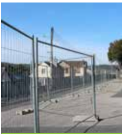
Sécurisation du périmètre février 2016

Les travaux continuent à l'école Jean-Jacques Rousseau, ils ont débuté en juillet 2015, et ont pour but la construction de son nouveau préau, d'une superficie avoisinant les 200 m 2 .