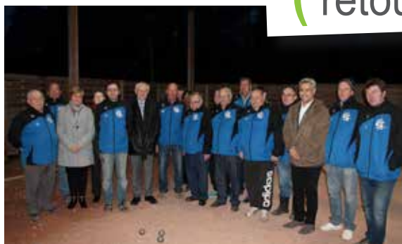
L'ALD pétanque a reçu ses nouvelles vestes lors de la remise officielle.