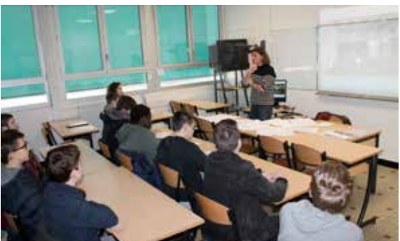
Forum des métiers au collège Jules Verne, l'heure pour les élèves de poser toutes leurs questions.