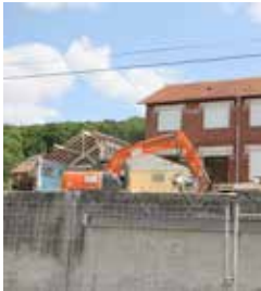
Début des travaux, phase de démolition - juillet 2015