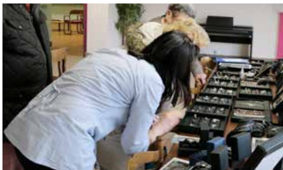
Une vente de bijoux a été organisée aux Hortensias, il y en avait pour tous les goûts.