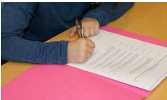
Cette année, ils sont 12 à avoir signé leurs contrats partenaires jeunes !