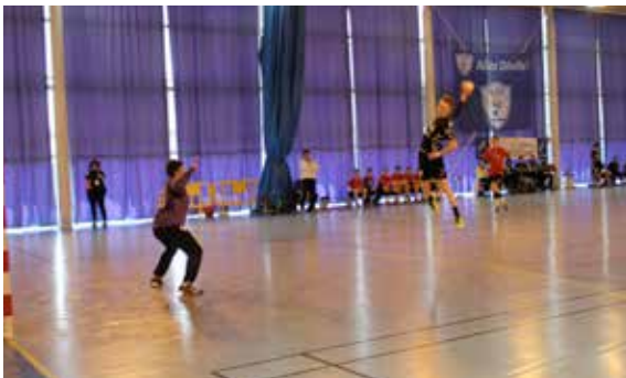
Le gymnase Anquetil a accueilli des matchs dans le cadre du mondial scolaire de handball.