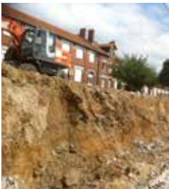
Création du talus juillet 2015