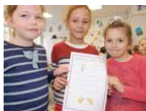
Repas à thème : les enfants fêtent le printemps et l'été