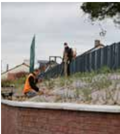
Création du talus - suite novembre 2015