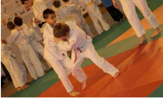
Un grand rendez-vous pour le 3 ème Tour Challenge Grand Rouen Judo Club !