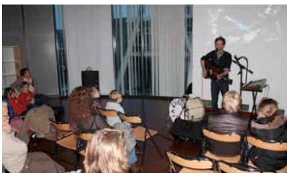
« La Chambre » était en concert à la médiathèque dans le cadre des musicales.