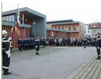
pompiers changement de chef de centre