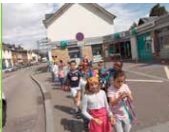
loisirs jeunesse l'été se prépare maintenant