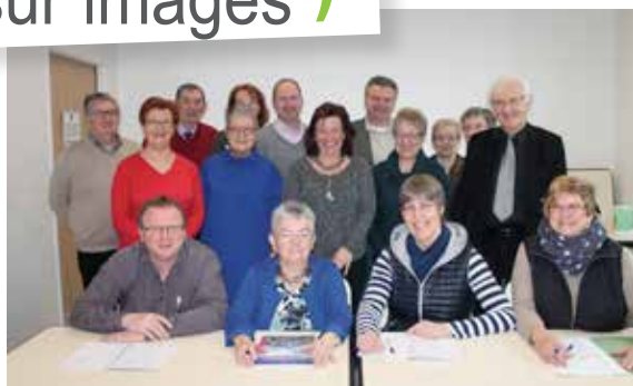
Réunion de travail franco-allemande dans le cadre du comité de jumelage avec Bargteheide.