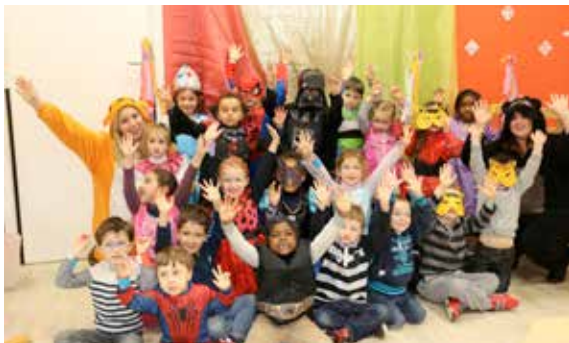
C'était carnaval aux accueils de loisirs. Danse et kermesse au programme.