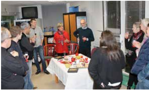
Le tennis club fête la nouvelle année et les retrouvailles autour d'un apéritif dînatoire.