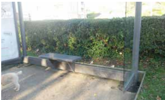
Très attendu par les usagers, le banc de l'arrêt de bus Fontenelle est enfin là !