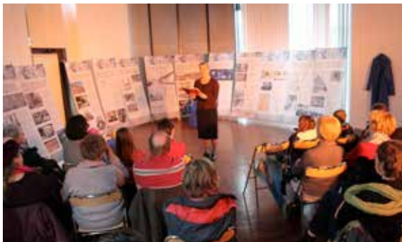
Spectacle « l'ouvrière inconnue », une lectrice, un public : une rencontre !

Comme tous les ans à cette date, le point principal de l'ordre du jour concerne le vote du budget 2016.