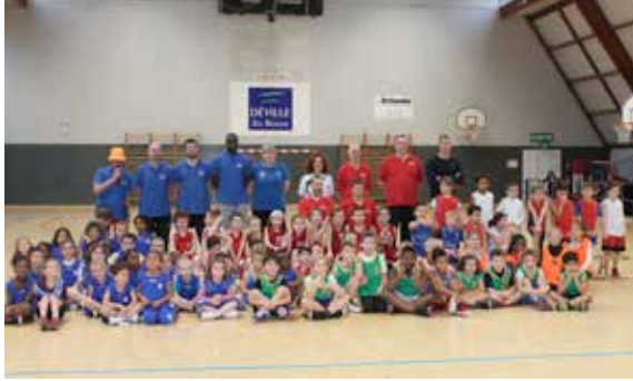
L'ALD basketball a obtenu le label fédéral EFMB : Ecole Française de Mini Basket.