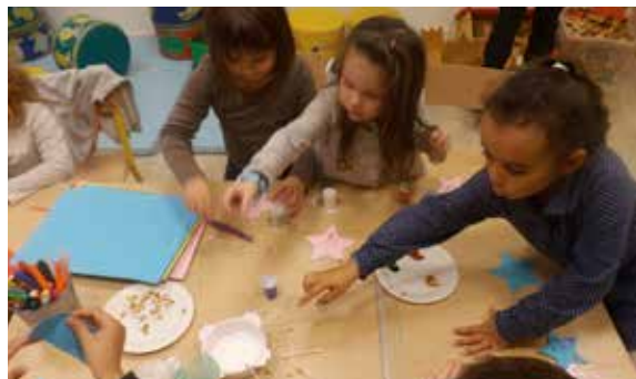
Atelier décoration de Noël à l'accueil de loisirs