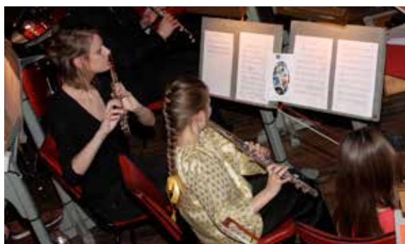
L'école municipale de musique, de danse et d'art dramatique a fêté ses 50 ans