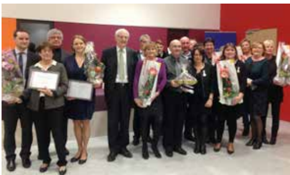
Mise à l'honneur des retraités, des agents et élues médaillés lors de la cérémonie des vœux au personnel municipal