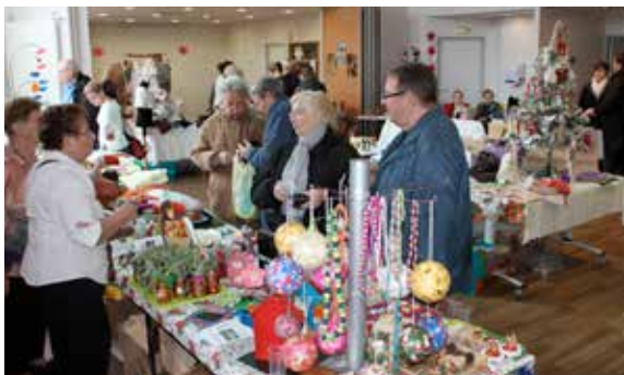
Les traditionnels marchés de Noël : de la Filandière...