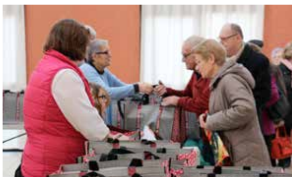
Distribution de colis de Noël aux seniors