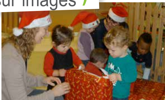
Après un spectacle présenté aux parents, c'est l'heure d'ouvrir les cadeaux à la maison de la petite enfance