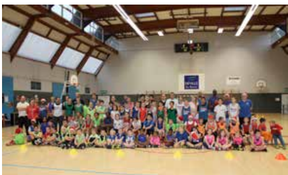
C'est Noël aussi pour l'ALD basketball....