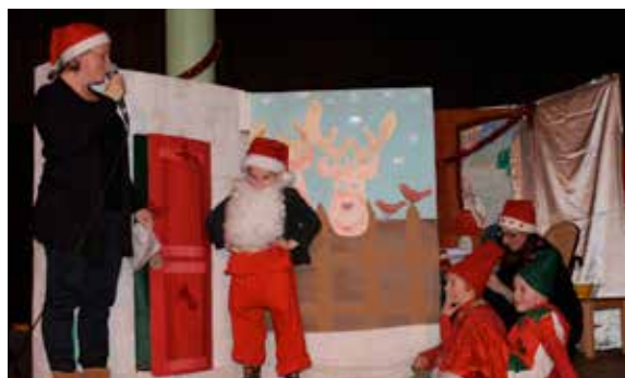
Le beau spectacle de Noël du Relais Assistants Maternels

Les inscriptions des enfants concernés se font à la maison de la petite enfance.