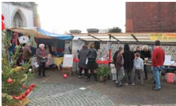
...et de la Paroisse de l'Eglise Saint Pierre