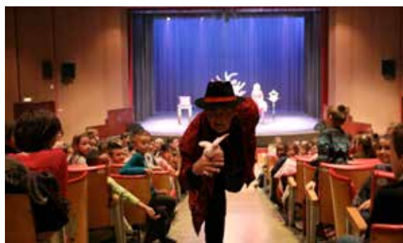
Spectacle pour le Noël offert par l'ALD aux enfants des écoles