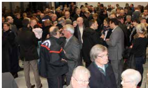
La Municipalité a présenté ses vœux aux corps constitués et aux associations à l'occasion de la nouvelle année