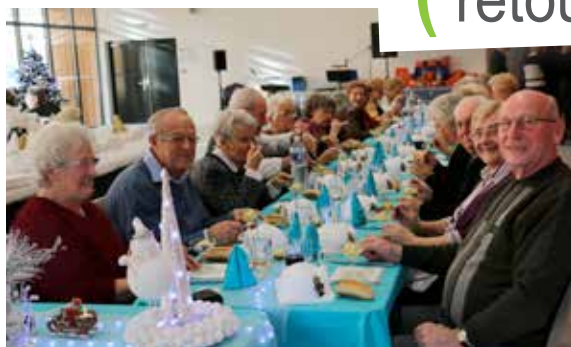
Traditionnel repas de Noël pour le foyer des anciens