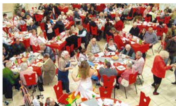
....et pour les amis rouennais des petits frères des pauvres